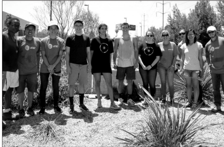
The Social Justice Learning Institute (SJLI) and eleven AT&T volunteers prepared the site for the future building of the La Tijera garden.

This specific garden build was sponsored by Whole Kids Foundation, nonprofit 501(c)(3) founded by Whole Foods Market. The