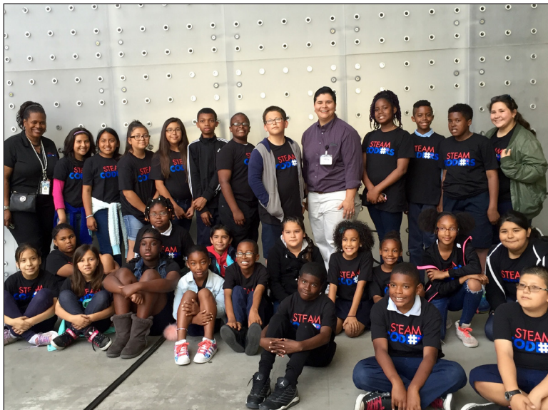
IUSD ASES students enjoy a day of interactive roller coaster mechanics at the California Science Center