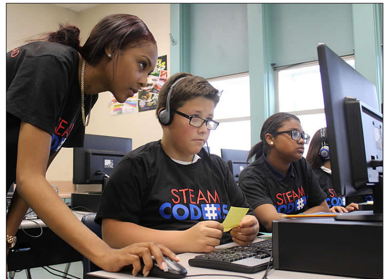
STEAM:CODERS help IUSD students learn computer coding.