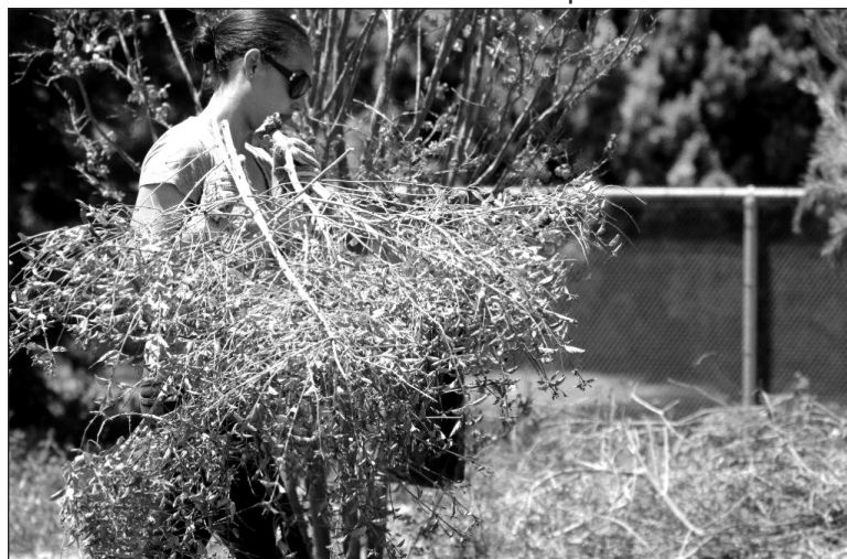
Volunteers worked to clean the garden area of unwanted plants and weeds.

Saturday, August 27th, Southern California Edison will