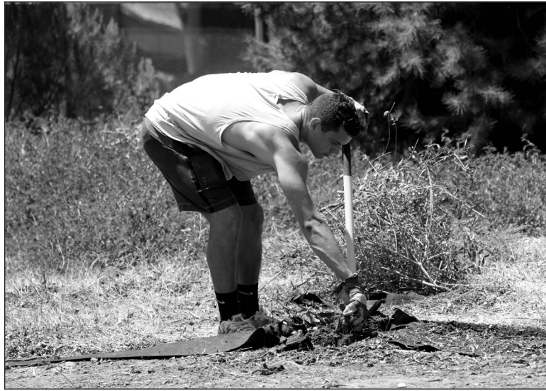
This volunteer is working hard to make sure the garden area has a clean slate before the garden is put in.

El distrito espera con anticipación al jardín de La Tijera e invita a la comunidad a asistir a cualquiera de los próximos días voluntarios. Para obtener más información, póngase en contacto SJLI al (323) 952-7363.